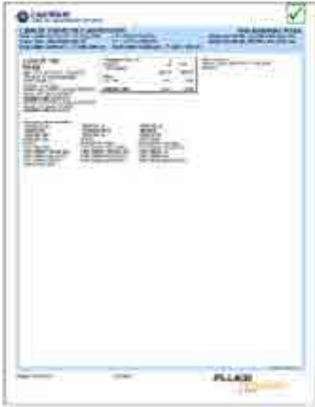
LinkWare Report with Encircled Flux and Test Reference Cards Tested