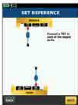
Automated set-up guide

welches den Techniker beim Setzen des Referenzwerts und bei der Überprüfung der Testreferenzkabel anleitet. Das animierte Hilfsprogramm hilft dabei, Fehler beim Testen des Dämpfungsverlusts zu vermeiden, die häufig zu unklaren negativen Dämpfungswerten führen.