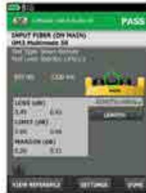
Detail shows margin and allowable limits for the fiber at this wavelength.